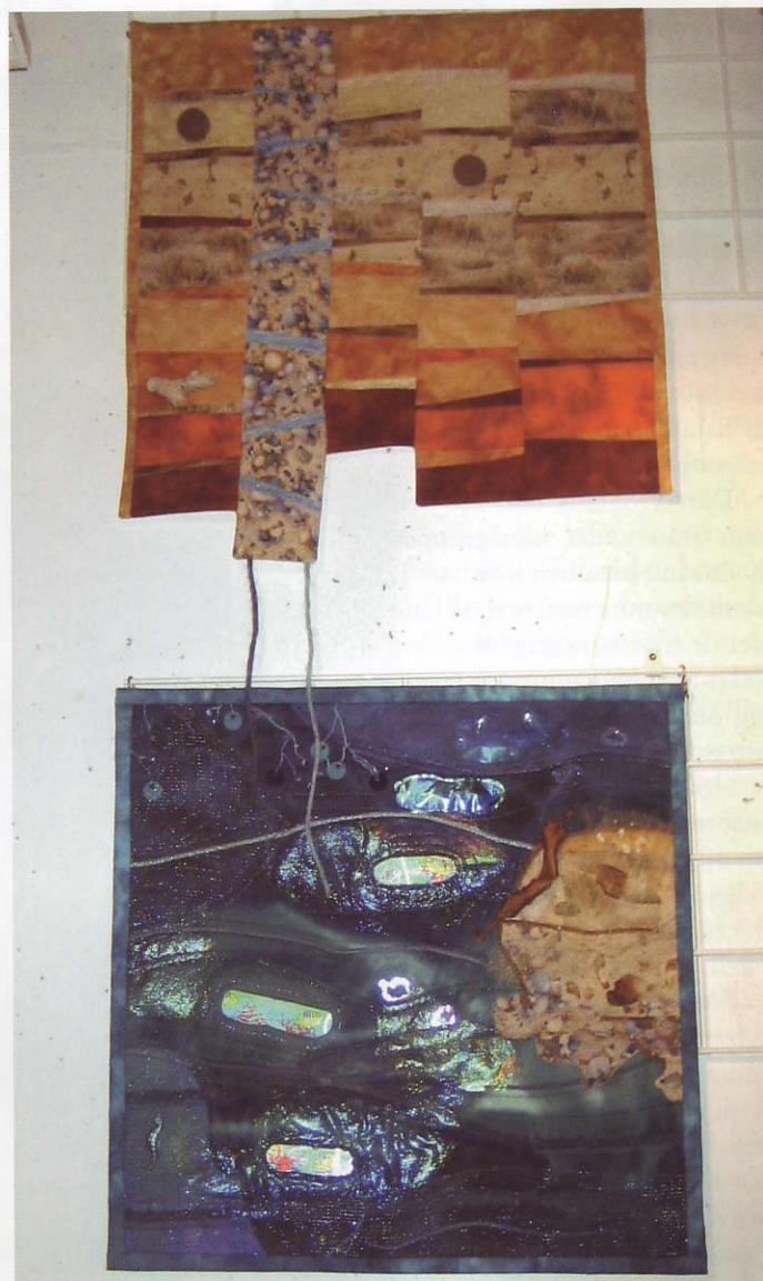
Kontraster: "Torr" sydd av Vera Cramer och "Vått" av Erika Bollinger.

–I våras fick jag följa med en schweizisk kviltväninna till hennes kviltgrupps utställning i en möbelaffär strax utanför Mönchaltorf mellan Zürich och Winterthur.