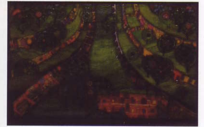
Kortbild, sydd av Ursula Blaser efter bild av ett av konstnären Hundertwassers verk.