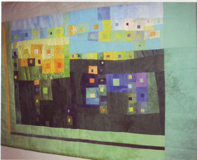
▲ "Smörbollar", Rut Bosshart, sytt efter kortet... ...av smörbollar (Trollblume på tyska) ▼