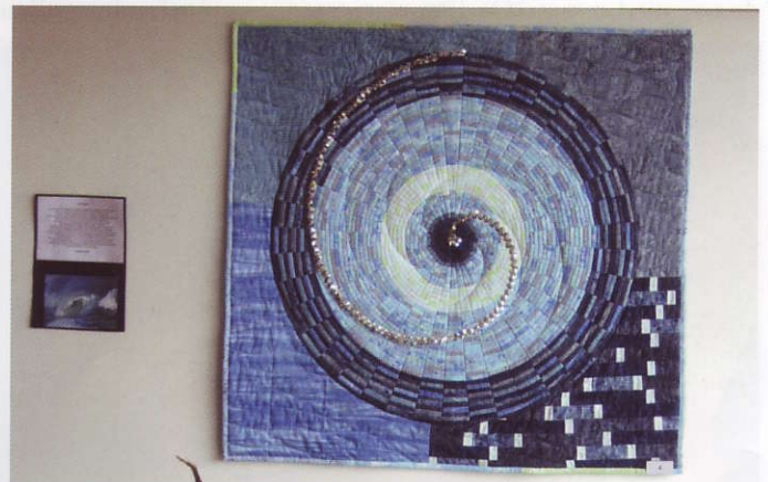
Kortbild sydd av Therese Hotz, utnämnd till juli månads kvilt av den schweiziska kviltföreningen.