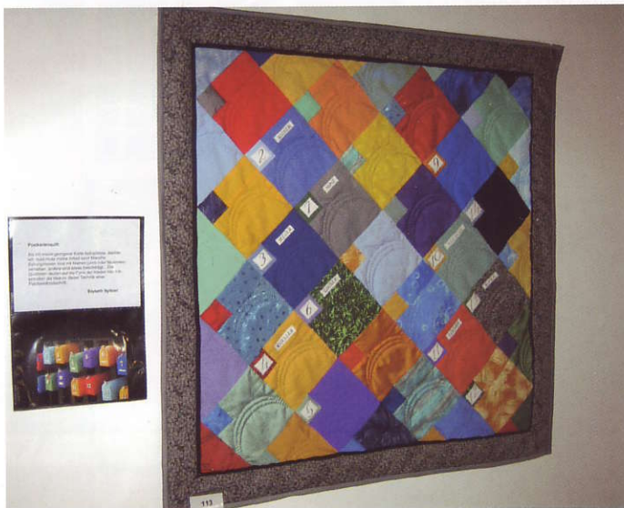
"Brevlådor", sydd av Elisabeth Nyfeler