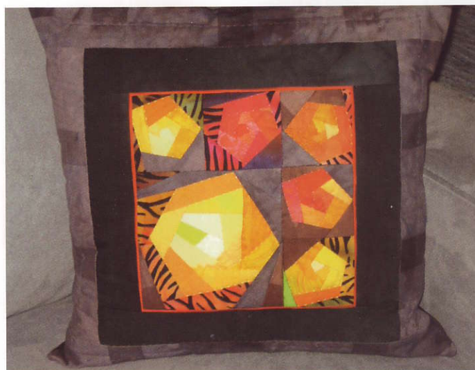
Kudde sydd av Ruth Bosshart